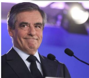
F. Fillon, 2016 devant le Medef

« il ne faut pas faire croire aux Français que cela va régler le problème des retraites [...] le système par points permet, chaque année, de baisser la valeur des points et donc de diminuer le niveau des pensions ».